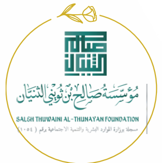
مؤسسة صالح بن ثويني الثنيان SALH THUWAINI AL-THUNAYAN FOUNDATION