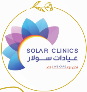
SOLAR CLINICS عيادات سولار نحن نرعى LOWE CARE كيم