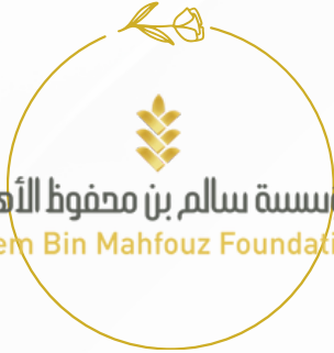
مؤسسة سالم بن محفوظ الأهلية Salem Bin Mahfouz Foundation